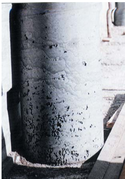
Figura 2: Calcestruzzo mal compattato.