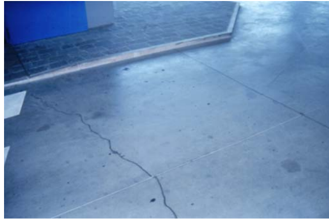
Figura 3: Calcestruzzo fessurato per mancata stagionatura.

Si è creata in sostanza una sorta di rigetto da parte di molti progettisti che non intendono “sporcarsi le mani” con il calcestruzzo. Il progettista ritiene in sostanza che si tratta di competenze da attribuire ad altri. Ci si potrebbe chiedere chi meglio del progettista sa quale calcestruzzo scegliere in funzione della struttura da realizzare: platea di fondazione ultra-armata, pile di un ponte, pavimentazione non armata, ecc. Chi meglio del progettista conosce le difficoltà esecutive dell’opera? Chi meglio del progettista conosce le conseguenze di fessure da ritiro su una struttura armata, che debbono essere prevenute mediante un’accurata stagionatura umida? In mancanza di queste indicazioni precise sul getto, sulla compattazione e sulla maturazione, sono più frequenti le contestazioni all’impresa per i difetti che talvolta si manifestano già in corso di opera. Non è meglio prevenire questi difetti e le conseguenti contestazioni che abbassano la qualità dell’opera e ne innalzano i costi di esercizio?