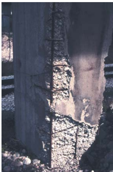
Figura 1: Calcestruzzo segregato.